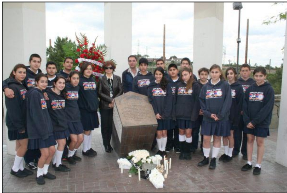
Յրդ կարգի աշակերտներու այցելութիւնը Մոնթեպելյոյի նահատակաց յուշարձան

Բոլոր դասարաններն ալ պատրաստեցին առիթին պատշաճ արտասանութիւններ, երգեր: Գրեցին շարադրութիւններ որոնք կ'ընդգրկեն քաջութիւն, ինքնավստահութիւն, վերականգնում, կորուստ, Յարութիւն եւ տակաւին հայրենիք եւ հայրենասիրութիւն... Միջնակարգի պարագային, վեցերորդ դասարանը պատրաստեց նաեւ Հայոց Յեղասպանութեան առիթով կառուցուած աշխարհա-