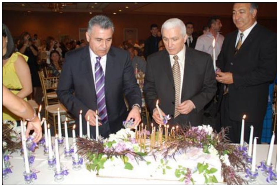
Սահակ-Մեսրոպ վարժարանի 30-ամեակի Մոմավառուփուն