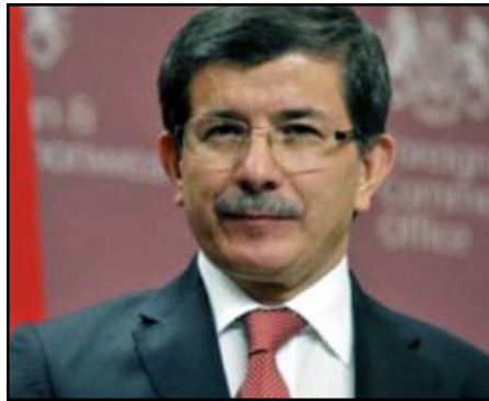
Թուրքիայի արտգործնախարար Ահմեդ Դավութօղլու

Թուրքիայի արտգործնախարար Ահմեդ Դավութօղլուն Անգլիայում թուրք մտաւորականների հետ հանդիպման ժամանակ եւ ինքնաթիռով Անքարա վերադառնալիս խօսել է հիմնականում Հայաստանի հետ յարաբերութիւնների կարգաւորման շուրջ՝ յայտարարելով, որ ամիսներ եւ նոյնիսկ շաբաթներ անց այդ խնդրում համաձայնութիւն է լինելու: Այս մասին իր հրատարակման մէջ տեղեկացնում է թուրքական Milliyet-ի թղթակից Ջան Դիւնդարը: Նա մասնաւորապէս գրում է.