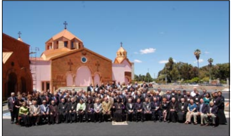
Թեմական Պատգամաւորական 83րդ ժողովի մասնակիցները

Թեմական Պատգամաւորական 83րդ ժողովի պատգամաւորներուն արձանագրութիւնը սկսաւ Ուրբաթ, Ապրիլ 30ի առաւօտեան ժամը 9:00ին: Իսկ 10:10ին Թեմակալ Առաջնորդ՝ Գերշ. Տ. Յովնան Արք. Տէրտէրեանի բացման արարողութեանէն ետք, ներկաները երգեցին «Սուրբ Աստուած»: Ապա «Հոգւոց» աղօթքը արտասանուեցաւ Թեմի հանգուցեալ հոգեւորականներէն Արժ. Տ. Վարդան Աւագ Քհնյ. Տիւրկէրեանի, Արժ. Տ. Գուրգէն Աւագ Քհնյ. Մուրատեանի, ինչպէս նաեւ Թեմէն ներս երկարամեայ նուիրեալ ծառայութիւն մատուցած ձան Պողոսեանի եւ ձեզ ձանտիկեանի հոգիներուն համար: