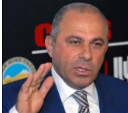
ՀՀ Ոստիկանապետ Ալիկ Սարգսեան

ՀՀ Ոստիկանութեան պետ Ալիկ Սարգսեանը ներողութիւն է խնդրել բոլոր այն մարդկանցից, որոնց իր յայտարարութեամբ ապատեղեկատուութիւն է տուել՝ պնդելով, կայ Չարենցաւանի ոստիկանութիւնում մահացած վահան իսլաֆեանին ոչ ոք ծեծի չի ենթարկել: