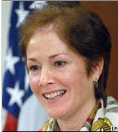
Միացեալ Նահանգներու դեսպան Մարի Ենվանովիչ

Հայաստանում Միացեալ Նահանգների դեսպանի համոզմամբ, հայ-թուրքական արձանագրութիւնների վաւերացման գործընթացի կասեցման մասին ուղերձով նախագահ Սերժ Սարգսեանը պարզ դարձրեց, որ Հայաստանը չի դադարեցնում թուրքիայի հետ մերձեցման գործընթացը, այլ սպասում է այն ժամանակին, երբ թուրքիան աւելի պատրաստ կը լինի դրան: