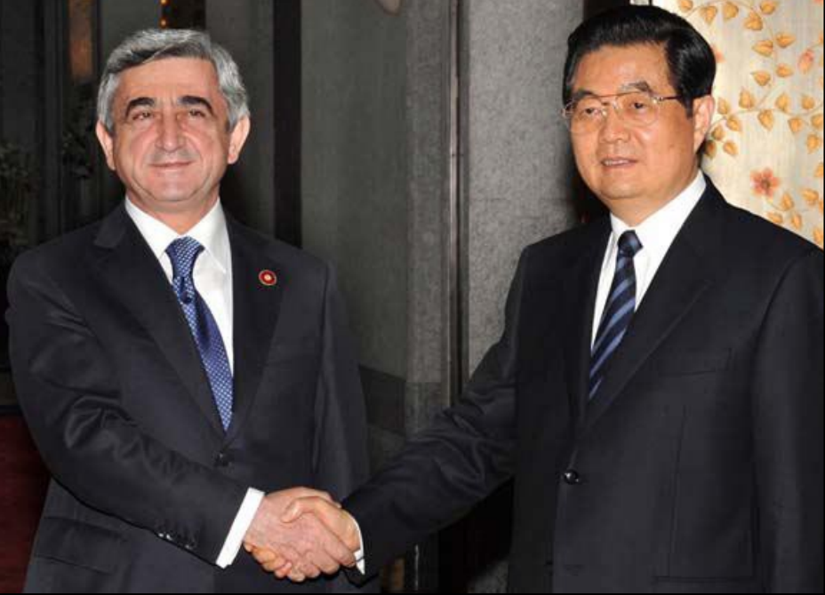
Սերժ Սարգսեան Զինաստանի նախագահ Եու Չինթայի հետ

Հայաստանի նախագահ Սերժ Սարգսեանը Զինաստան կատարած այցի շրջանակում Մայիս 3-ին հանդիպել է այդ երկրի նախագահ Եու Չինթայի հետ: