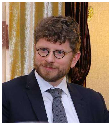
Հայաստանի մէջ Ֆրանսայի դեսպան Օլիվիէ Տըքոթինյի եւ կրօնական ժառանգութեան պաշտպանութեան հարցով», - գրած է Տըքոթինյի: