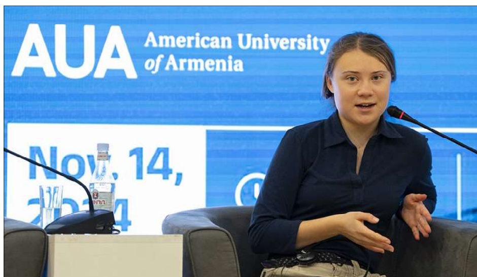
Յայտնի բնապահպան, աքթիվիսթ Կրեթա Թունպերկ Երեւանի մէջ

Վրաստանի մէջ բողոքի հաւաքներ կատարելէ յետոյ Հայաստան ժամանած յայտնի բնապահպան, աքթիվիստ Կրեթա Թունպերկ Երեւանի մէջ մասնակցած է «Ատրպեյճանի յարձակման ազդեցութիւնը մարդու իրաւունքներու եւ շրջակայ միջավայրի պաշտպանութեան վրայ» թեմայով համաժողովին: