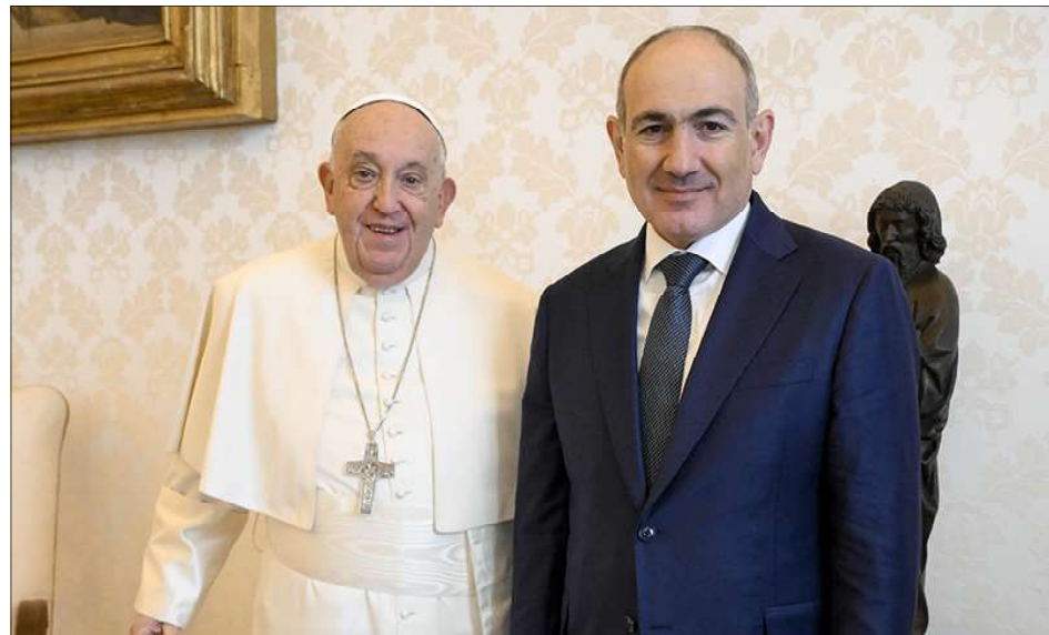
Վարչապետ Նիկոլ Փաշինեանի հանդիպումը է Հռոմի Ֆրանչիսկոս պապին հետ

Վատիկան գտնուող վարչապետ Նիկոլ Փաշինեան հանդիպած է Հռոմի Ֆրանչիսկոս պապին հետ եւ տեղեկացուցած է Հայաստան-Ատրպեյճան խաղաղութեան գործընթացի վերջին զարգացումներուն մասին եւ վերահաստատած է Հայաստանի կառավարութեան հաւատարմութիւնը խաղաղութեան օրակարգին: