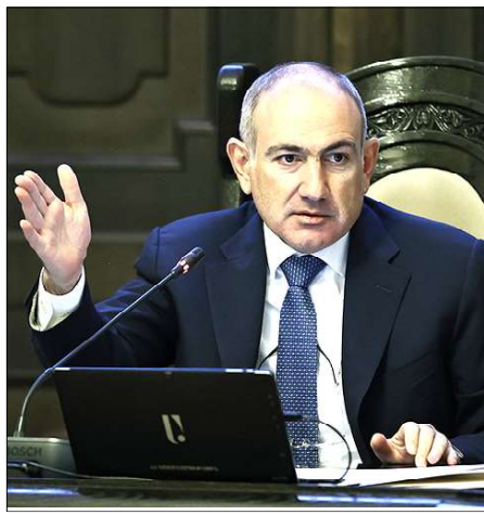
Վարչապետ Նիկոլ Փաշինեան

Սակայն թէ ինչու արդիւնքներ չկան, հանրութիւնը չեղափոխութիւնով իշխանութեան եկած վարչապետէն կ'ակնկալէ, երկրի ղեկավարը՝ իրաւապահ համակարգի պատասխանատուներէն. «Սրա վերջը եկել է. ես էլ բան չունեմ տալու, այն, ինչ ինձնից ուզել էք, տուել եմ: Էլ ինչն ունի մարդիկ, ովքեր հանրապետութիւնում ճշմարիտներ-վառիկներ էին անում, նոյնն անում են: Ընդդիմութիւնն ասում է՝ էս թուին սա ես ասել, իշխանութիւնից մէկը չի եկել, ասի՝ էս թուին սա ես ասել, հիմա